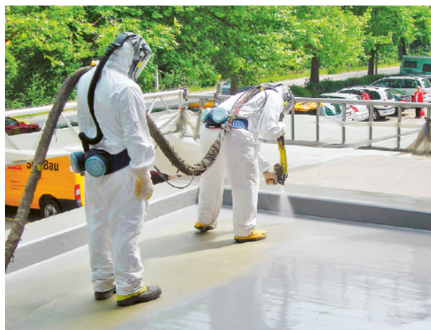
12 Per l'applicazione a spruzzo dei poliuretani sono necessarie severe misure di protezione, anche per chi si trova nelle vicinanze.