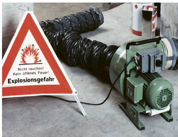
18 Utilizzate un ventilatore con protezione EX. Aspirare i vapori è molto più efficace che far confluire aria fresca dall'esterno.

Pubblicazioni «Liquidi infiammabili» su www.suva.ch/1825.i e n.2153.i «Protezione contro le esplosioni»