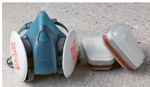
23 Una semimaschera con filtro antipolvere è utilizzabile più volte. Equipaggiata di un filtro a carbone attivo (a destra) protegge anche dai vapori dei solventi.

I guanti sporchi e le maschere monouso usate non offrono più nessuna protezione. Perciò il datore di lavoro deve mettere a disposizione questi articoli in quantità sufficiente. Lo stesso vale per gli occhiali di protezione graffiati perché, in tali condizioni, non vengono più indossati dai collaboratori.