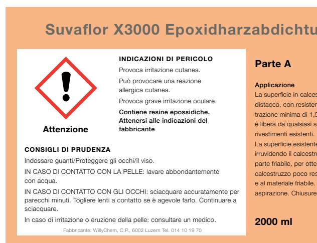
1 L'etichettatura segnala i pericoli e le principali misure di protezione.

Anche sui contenitori riempiti in azienda bisogna indicare le caratteristiche pericolose del prodotto.