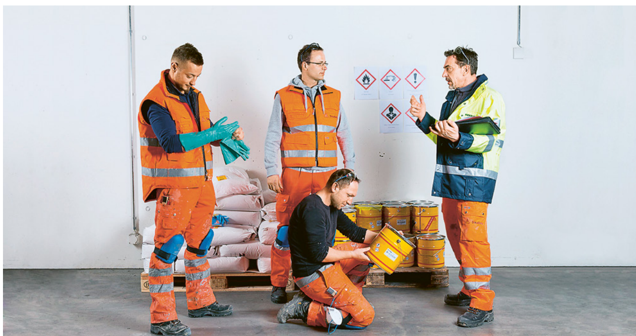
5 Istrate i vostri collaboratori sui pericoli e le misure di protezione direttamente sul posto.