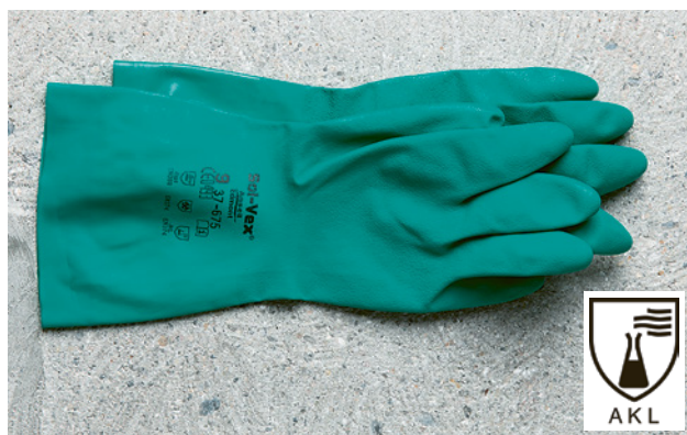
20 Guanti di protezione contro i prodotti chimici. Informatevi sul grado di protezione dei vostri guanti.