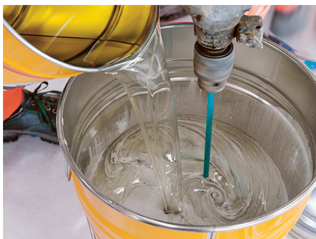
6 Le componenti della resina sintetica reagiscono fra loro. Può essere pericoloso per la salute.