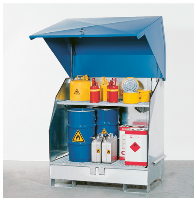
27 Deposito richiudibile per le sostanze pericolose.

Siate prudenti quando maneggiate i contenitori che contengono ancora residui di prodotti chimici. Tenete presente che le prescrizioni per lo stoccaggio dei solventi si applicano anche ai rifiuti contenenti solventi.