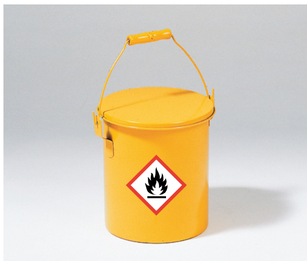
17 Contenitore chiuso e contrassegnato in cui immergere gli oggetti da pulire con il diluente.

I collaboratori sono particolarmente esposti al pericolo quando lavorano in locali chiusi o in pozzi, cisterne, fosse e altri ambienti mal ventilati. I luoghi angusti sono problematici dal punto di vista della sicurezza e della tutela della salute soprattutto quando si lavora con sostanze nocive che emanano vapori, polveri e fumi. Per indicazioni in materia consultare la pubblicazione su www.suva.ch/44040.i «Ambienti di lavoro ristretti: cosa fare contro il rischio di esplosione, intossicazione e asfissia?».