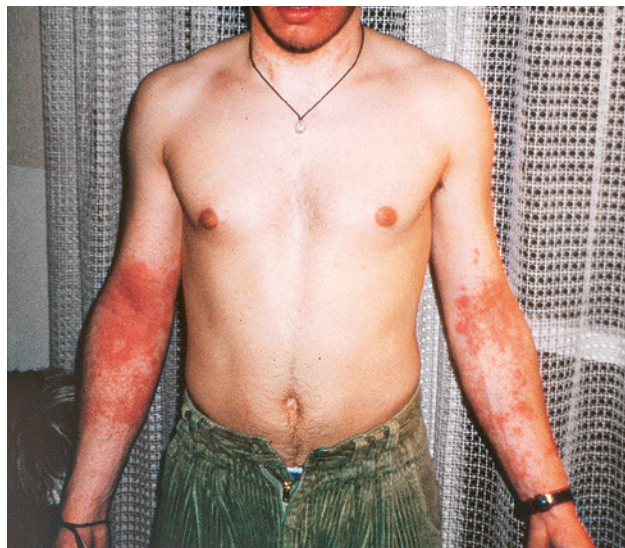
10 La conseguenza del contatto con le resine epossidiche: un'allergia cutanea.