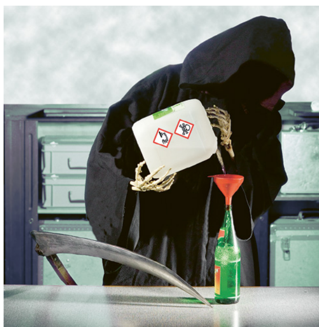
25 Mai travasare prodotti chimici in bottiglie per bevande!

Ulteriori informazioni nella pubblicazione «Lista di controllo piano di emergenza» su www.suva.ch/66061.i