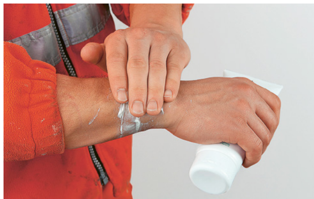
22 Applicata prima del lavoro, la crema garantisce una protezione di base contro i prodotti chimici.