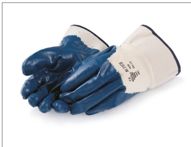
16 I guanti foderati sono una buona scelta per lavorare con il cemento.