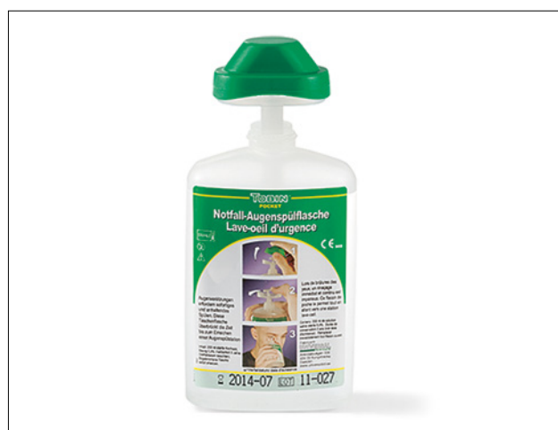
14 Un piccolo flacone per il lavaggio oculare (da 2 dl) trova posto ovunque.