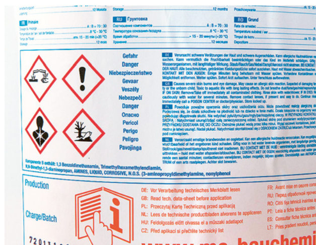
9 Avvertenza «Contiene epossidi». Talvolta le informazioni più importanti sono difficili da trovare.