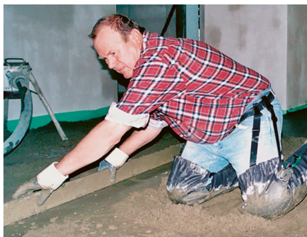
15 Con i «pantaloni di protezione» o le ginocchiere impermeabili si evitano le lesioni da cemento.

Lista di controllo «Eczema da cemento» su www.suva.ch/67030.i