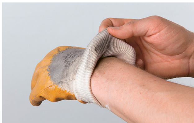
21 Lavorare indossando guanti sporchi è dannoso perché la pelle rimane a lungo a contatto con sostanze chimiche.