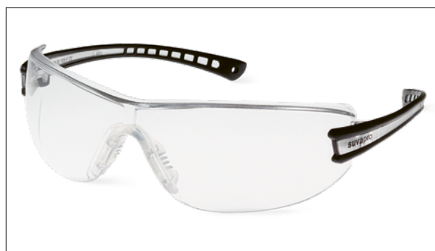
24 Degli occhiali di protezione leggeri sono sufficienti per ripare gli occhi da singoli spruzzi.