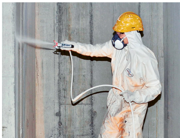
19 Quando si applicano a spruzzo prodotti contenenti solventi si devono sempre adottare le misure di prevenzione contro le esplosioni, oltre a utilizzare apparecchi di protezione delle vie respiratorie.