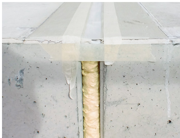
11 Sono molti i prodotti che contengono poliuretani, non solo le schiume per montaggio.

I prodotti a base d'acqua sono spesso più rispettosi dell'ambiente. Ciò non significa però che non siano pericolosi per la salute. Anche i prodotti a base d'acqua possono contenere sostanze chimiche pericolose, ad esempio l'isocianato in alcuni smalti ad acqua. Tali prodotti contengono spesso anche dei solventi, seppur in piccole concentrazioni.