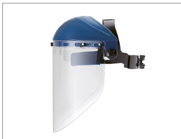
13 Una visiera protegge gli occhi e il viso quando si lavora con liquidi pericolosi.