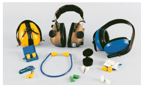
6 Exemples de protecteurs d'ouïe.