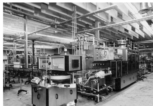
5 Baffles en panneaux acoustiques de laine minérale dans une entreprise produisant des boissons (installation de remplissage).