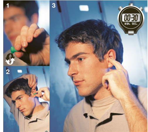
2 Utiliser correctement les tampons auriculaires.

Valeur limite d'exposition aux postes de travail: L_{EX, 8h} \geq 85 dB(A) rapportée à une journée. Vous trouverez d'autres informations à ce sujet dans le tableau des niveaux sonores de votre branche. Liste complète des tableaux disponibles: www.suva.ch/86005.f .