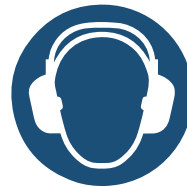
1 Porter des protecteurs d'ouïe.