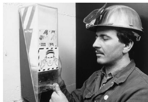
7 Distributeur de protecteurs d'ouïe: les protecteurs d'ouïe doivent être facilement disponibles à tout moment.