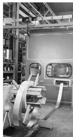
4 Enceinte intégrale sur une presse automatique.