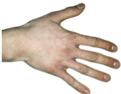
Primi segnali di un'irritazione

Una cura regolare è fondamentale per conferire alle mani un bell'aspetto.