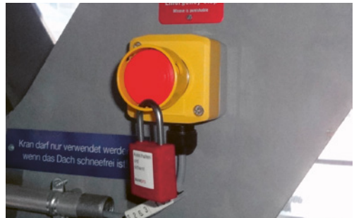
3 Not-Halt-Einrichtung beim Zugang zur Gefahrenstelle.