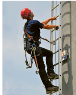
2 Ab 3 m Absturzhöhe braucht es eine Steigschutzeinrichtung.