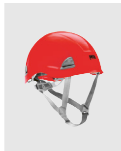
6 Beim Arbeiten in der Höhe muss ein Schutzhelm mit Kinnriemen getragen werden.