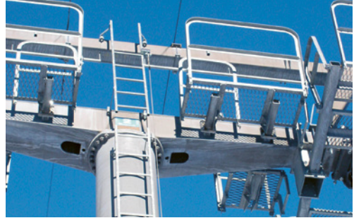
1 Arbeitspodeste mit Seitenschutz