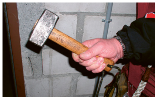
8 So können Werkzeuge nicht hinunterfallen, z. B. mit Sicherungsleine am Hammer für das Befestigen am Gurtzeug.