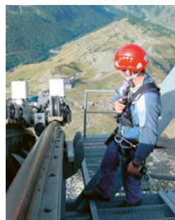
7 Sichere Kommunikation durch disziplinierten Funkverkehr.