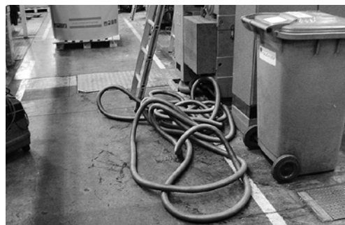
5 Attenzione al pericolo d'inciampare