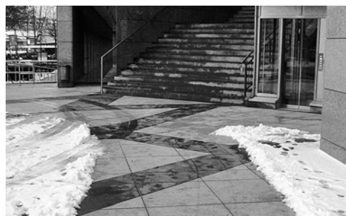
2 Percorso liberato dalla neve e dal ghiaccio