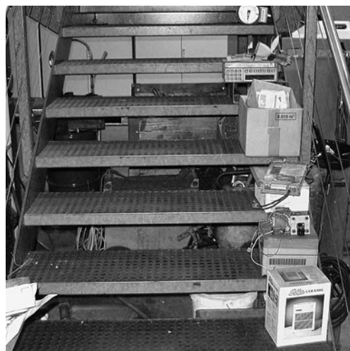
8 I pericoli d'inciampare sulle scale possono essere fonte di gravi infortuni.

È possibile che nella vostra azienda esistano altre fonti di pericolo su questo argomento.