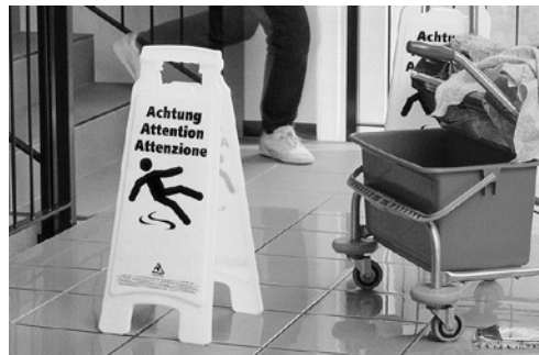
1 Triopan: utensile pratico che permette di rendere attento al pericolo temporaneo di scivolare e di inciampare.

Eppure le cadute in piano si possono prevenire con misure semplici e mirate.