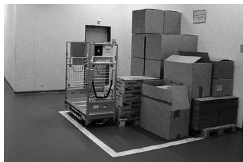
4 Le vie di circolazione e il posto per il deposito delle merci sono segnalati e separati in modo esemplare.