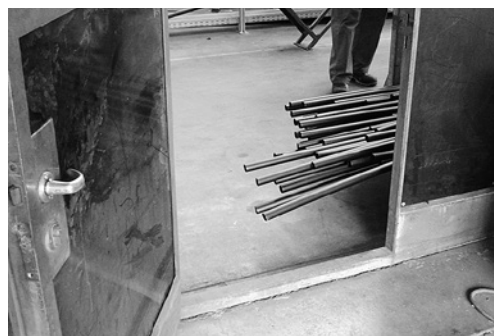
7 Attenzione al pericolo di inciampare. Pensare anche ai colleghi di lavoro.