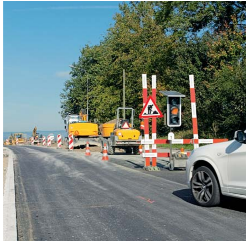
Regel 2: Wir sichern uns vor den Gefahren des Verkehrs.