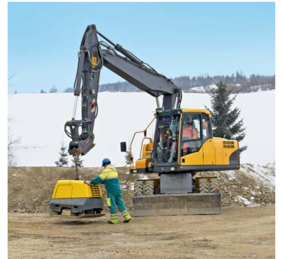
Regel 6: Wir transportieren und versetzen Lasten sicher.