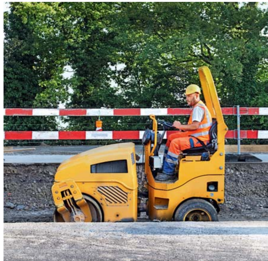
Regel 5: Wir bedienen Maschinen vorschriftsgemäss.