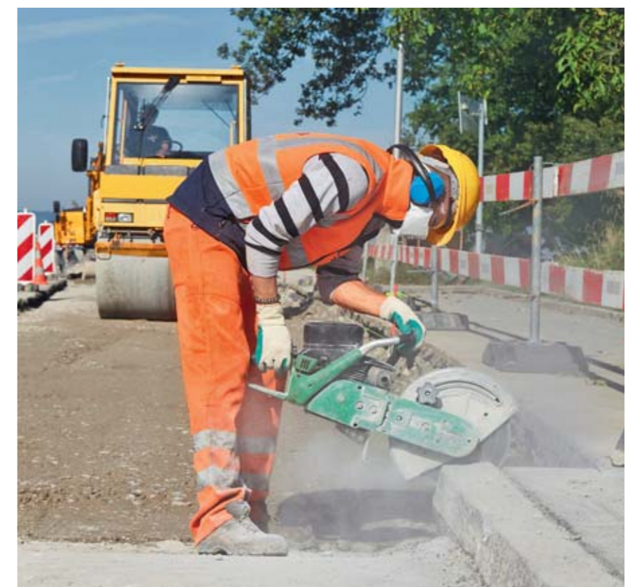
Regel 9: Wir tragen die persönliche Schutzausrüstung.