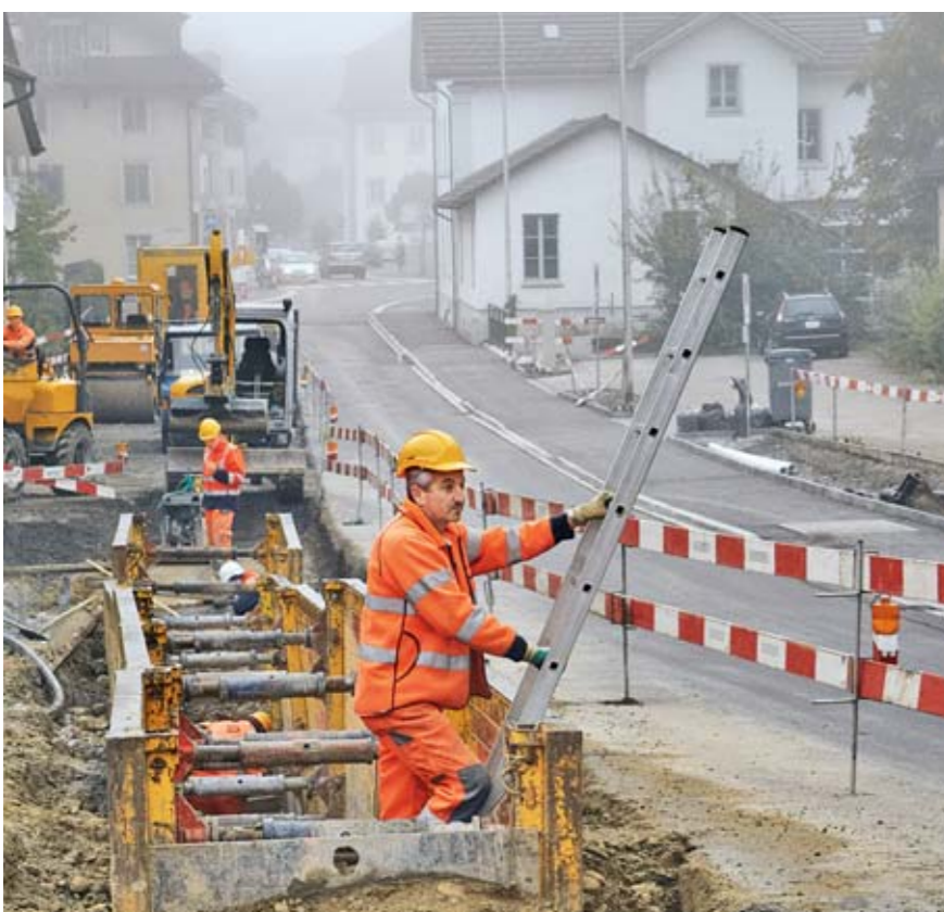
Regel 7: Wir erstellen sichere Zugänge zu sämtlichen Arbeitsplätzen.