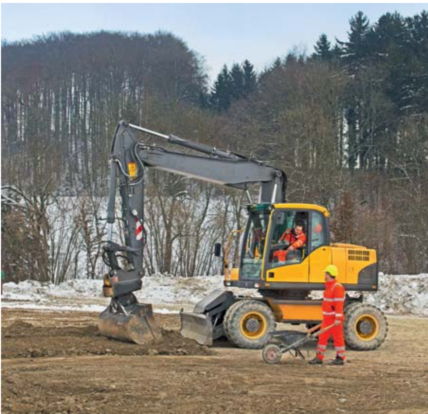
Regel 4: Wir halten Blickkontakt mit dem Maschinenführer.