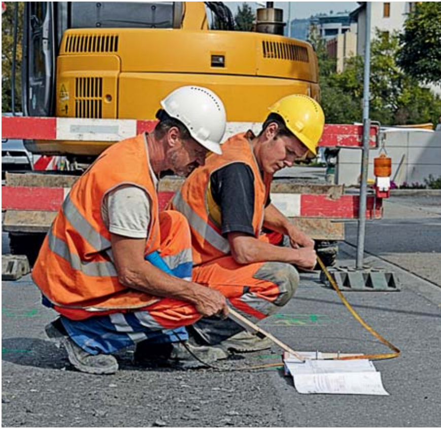
Regel 1: Wir planen den Arbeitseinsatz sorgfältig.

Stopp bei Gefahr Gefahr beheben Weiterarbeiten www.suva.ch/regeln