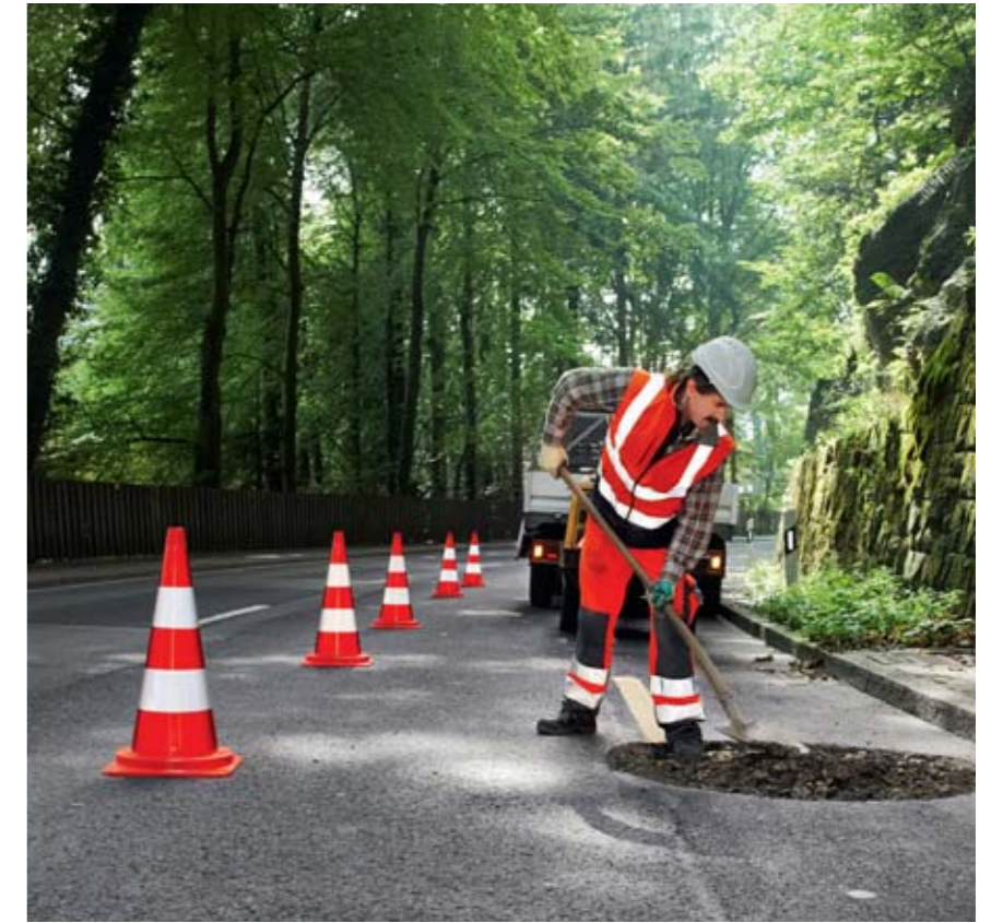
Regel 3: Sehen und gesehen werden.