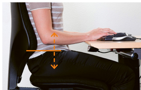
4 Le réglage de la hauteur du dossier permet de positionner correctement le support lombaire.