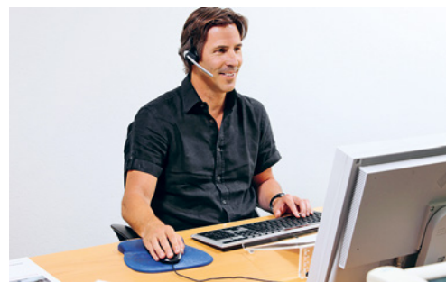
8 Le kit mains libres est un accessoire indispensable pour les utilisateurs fréquemment occupés au téléphone.