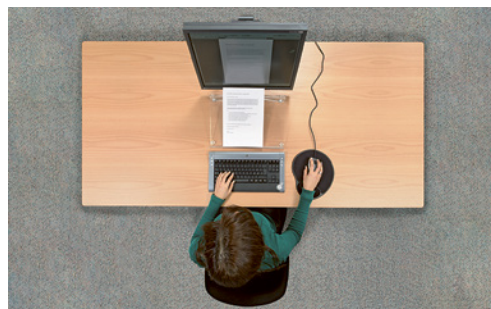
1 Le plan de travail doit avoir une profondeur suffisante pour permettre de placer des documents entre le clavier et l'écran.