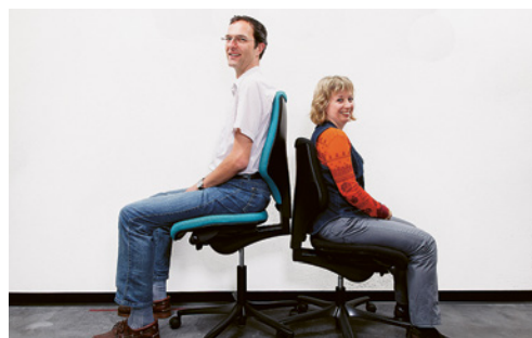
3 Les sièges standard sont généralement inadaptés aux personnes de grande taille. De nombreux fabricants proposent des modèles «grande taille».