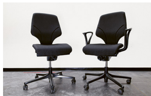
5 Les accoudoirs permettent aux personnes corpulentes ou souffrant de douleurs aux genoux de s'asseoir et de se lever plus facilement, mais n'ont pas d'utilité ergonomique.

Si vous optez pour des accoudoirs, ces derniers doivent être courts et réglables en hauteur ou en profondeur.