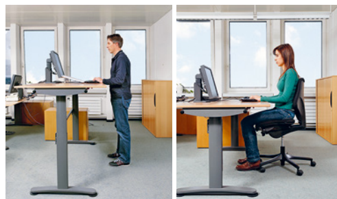
2 Table dotée d'une plage de réglage de 65 à 125 cm convenant aussi bien à une personne de petite taille travaillant assise qu'à une personne de grande taille travaillant debout.