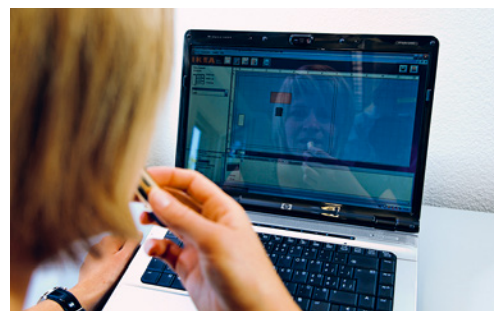
7 Les écrans brillants ne sont pas adaptés car ils produisent des reflets désagréables.