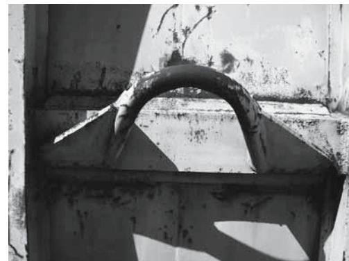
Fig. 5: il convient de contrôler si les étriers de levage et leurs renforcements ne sont pas fissurés, déformés ou usés.