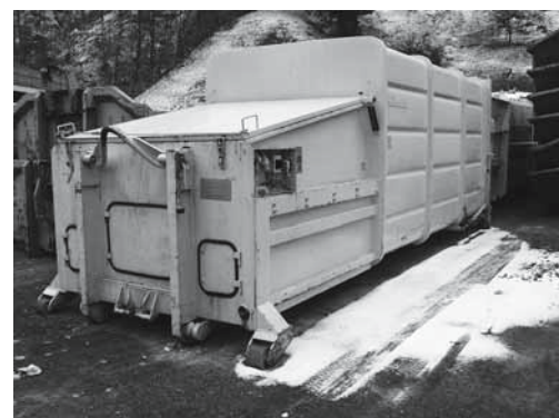
Fig. 6: conteneur spécial. La maintenance du circuit hydraulique et de l'installation électrique doit être assurée par une personne spécialisée.