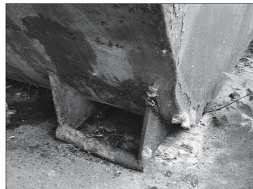
Fig. 4: les articulations de basculement fissurées ou endommagées doivent être changées ou réparées.