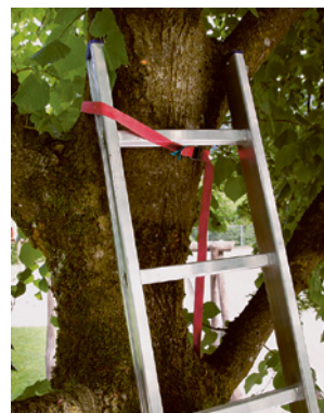
2 Messa in sicurezza della scala con cinghia di fissaggio intorno alla chioma