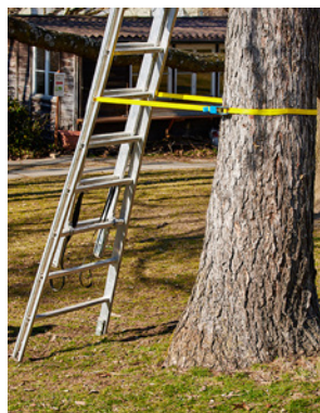
1 Messa in sicurezza della scala con cinghia di fissaggio intorno alla base del tronco