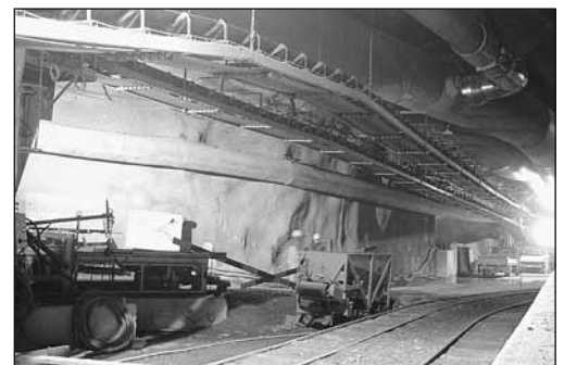
Fig. 4: Bande transporteuse couverte et lignes d'alimentation situées hors de la zone utilisée par les véhicules.