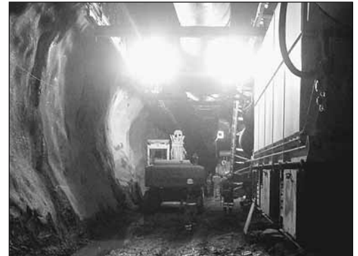
Fig. 1: Personnes mises en danger par des véhicules de transport par manque de place lors d'une opération de minage.