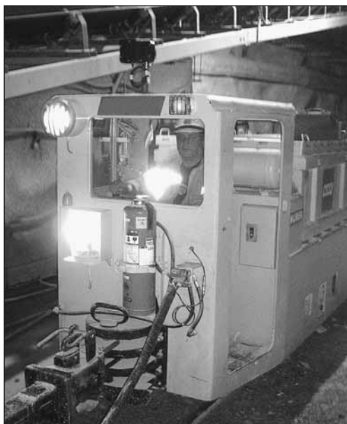
Fig. 10: Il faut définir qui conduit les véhicules de transport en cas d'urgence.

Si vous avez constaté dans votre entreprise d'autres dangers qui concernent le sujet de la présente liste de contrôle, veuillez prendre les mesures qui s'imposent et les inscrire au verso.