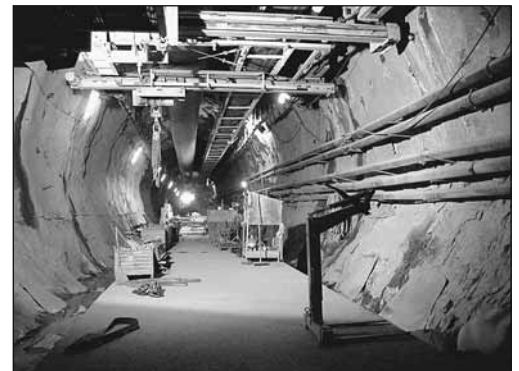
Fig. 3: Utilisation d'une bande transporteuse suspendue qui permet de désengorger le trafic dans la zone de travail.