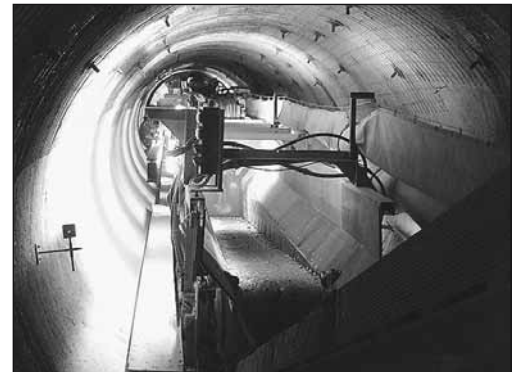
Fig. 2: Les espaces nécessaires doivent également être pris en compte pendant la phase de planification de l'ouvrage et des installations.