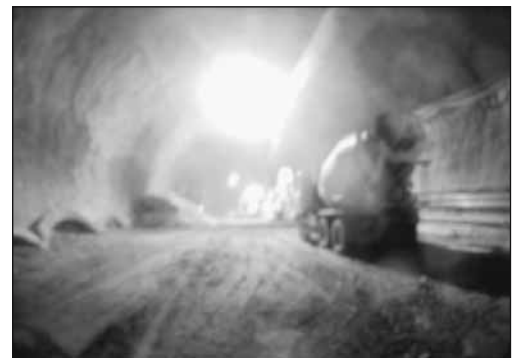
Fig. 7: Vue de l'écran de la caméra.