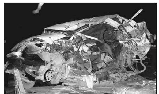
Fig. 8: Le fait que le conducteur de la locomotive ait une vision trop restreinte de la zone dangereuse (par ex. couche de buée sur la caméra) peut avoir des conséquences désastreuses.