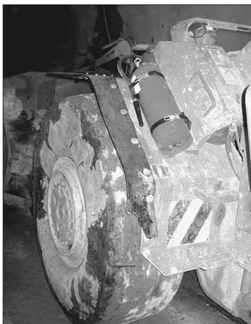
Fig. 9: Chargeuse sur pneus munie d'un extincteur.