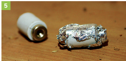
1 Laieninstallation, 2 defektes Sicherungselement, 3 defekte Abdeckungen, 4 alte Scherenleuchte, 5 defekte Sicherung, 6 Porzellan-Steck- und -Abzweigdosen