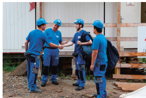
1 All'inizio del tirocinio bisogna presentare agli apprendisti le persone di riferimento per la sicurezza sul lavoro e la tutela della salute.

«È vietato l'impiego di giovani per lavori pericolosi». Si possono affidare lavori pericolosi agli apprendisti soltanto in base al loro grado di formazione e a condizione che ciò sia esplicitamente previsto nell'ordinanza sulla formazione professionale di base per il mestiere in questione.