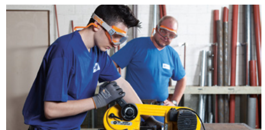
5 Verificare se gli apprendisti mettono in pratica correttamente ciò che hanno imparato.

È possibile che nella vostra azienda esistano altre fonti di pericolo riguardanti il tema della presente lista di controllo. In tal caso, occorre adottare i necessari provvedimenti e annotarli sull'ultima pagina.