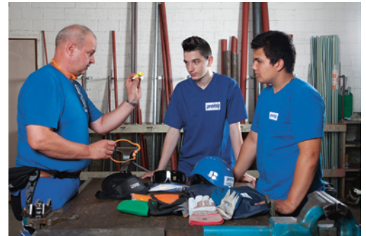
2 Gli apprendisti devono avere i DPI il primo giorno di lavoro e pertanto bisogna ordinarli prima del loro arrivo in azienda.

In collaborazione con l'addetto alla sicurezza accertatevi che gli apprendisti e i dipendenti dell'azienda conoscano le «regole vitali». Vedi www.suva.ch/regole