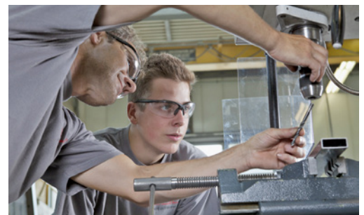
4 Gli apprendisti vanno istruiti in maniera approfondita, ma senza subissarli di informazioni.