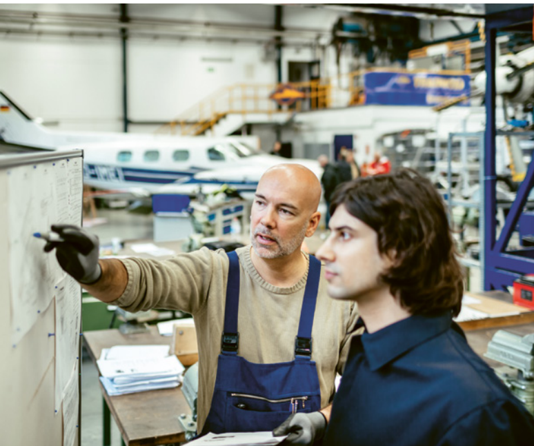
1 Die Sicherheitsbeauftragten brauchen Einfühlungsvermögen, Überzeugungskraft und Fachwissen.

Die Sicherheitsbeauftragten (SiBe) brauchen für ihre Tätigkeit spezielle Kenntnisse und Fähigkeiten. Sie müssen sorgfältig ausgewählt und gezielt geschult werden. Wenn Sie als Betriebsleiter oder Betriebsleiterin eines kleinen Betriebs die Funktion des SiBe selbst wahrnehmen, ist es wichtig, dass Sie ebenfalls über das erforderliche Know-how für diese Aufgabe verfügen.