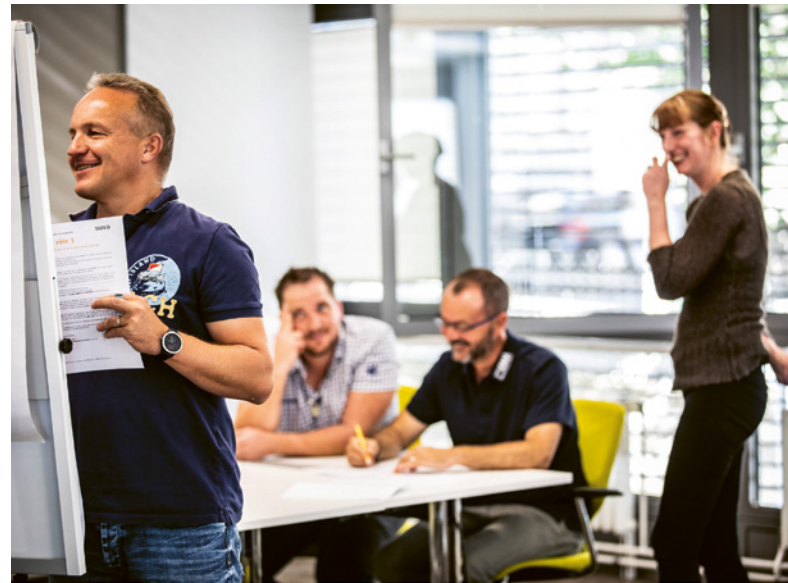
5 Arbeitssicherheit und Gesundheitsschutz müssen bei den verschiedenen betriebsinternen Besprechungen ein festes Traktandum sein.

Mit all diesen Massnahmen sorgen Sie dafür, dass in Ihrem Unternehmen eine gelebte Sicherheitskultur entsteht.