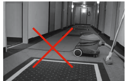
Figure 8: risque de chutes de plain-pied en raison du câble traversant le couloir.