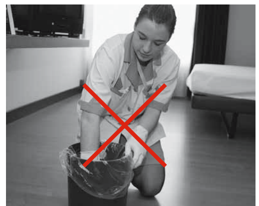
Figures 3 et 4: protection contre les blessures grâce aux sacs plastiques placés dans les poubelles, au transport des sacs tenus de façon lâche et à la non-compression des déchets.