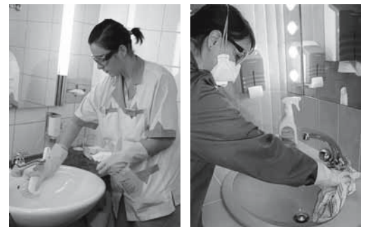
Figures 6 et 7: utilisations correctes d'anticalcaires avec de l'acide. Il faut porter un masque de protection respiratoire si le local n'est pas assez aéré.