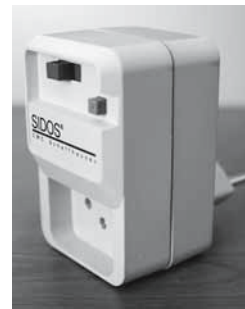
Figure 1: les magasins spécialisés vendent des interrupteurs FI spéciaux.

Remarque: des sols en céramique ou en pierre peuvent être rendus antidérapants par des entreprises spécialisées.