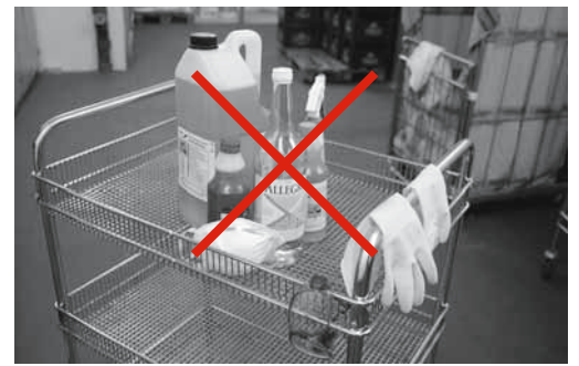
Figure 5: pour éviter les confusions et les empoisonnements, il faut conserver les produits uniquement dans leur emballage d'origine.