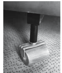
Figure 2: des roulettes fixées sous le lit permettent son déplacement sans forcer au niveau du dos.