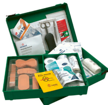
2 La pharmacie de premiers secours doit être à portée de main aux postes de travail mobiles.