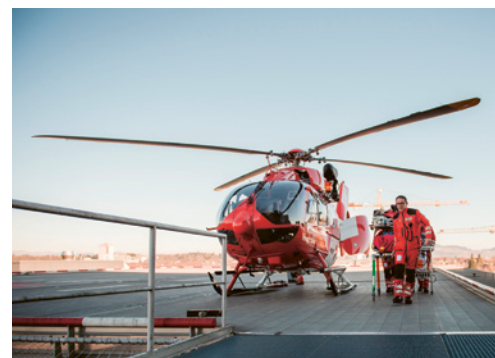
4 Déterminer les coordonnées pour un éventuel secours aérien.

Si vous avez constaté d'autres dangers concernant ce thème sur votre lieu de travail, notez également au verso les mesures qui s'imposent. En cas de doute, faites appel à un spécialiste.