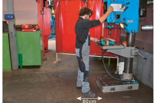
1 Für ein sicheres Arbeiten ist ein Freiraum von mindestens 80 cm erforderlich. Weitere Kriterien: frei von Stolperfallen