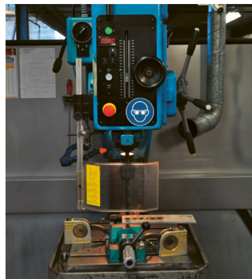
4 Verriegelte, trennende Schutzvorrichtung: schwenkbare Bohrer-Verdeckung

18 Werden die Bohrmaschine und insbesondere die Sicherheitseinrichtungen regelmässig gewartet und überprüft? ja nein Die Wartung ist nach den Angaben des Herstellers durchzuführen und zu dokumentieren.