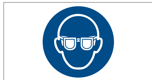
5 Das Gebotszeichen Augenschutz benutzen ist für den Bediener gut sichtbar an die Bohrmaschine anzubringen.