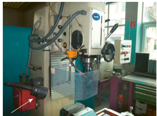
2 Eine lokale Hilfslampe (links) sorgt für gute Beleuchtung im unmittelbaren Bohrbereich.