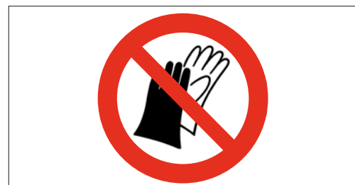
6 Bei laufender Maschine dürfen keine Handschuhe getragen werden.