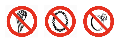
7 Lange Haare sind zusammenzubinden oder zu verdecken. Halsschmuck und Handschmuck dürfen an Bohrmaschinen nicht getragen werden.