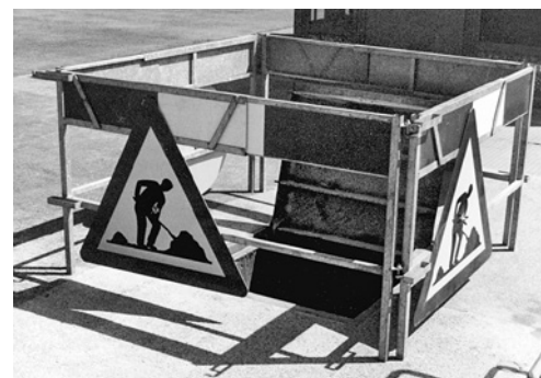
5 Sbarramento di uno scavo; i pericoli che derivano dallo svolgimento dei lavori presso il cliente devono essere minimizzati in collaborazione con quest'ultimo.