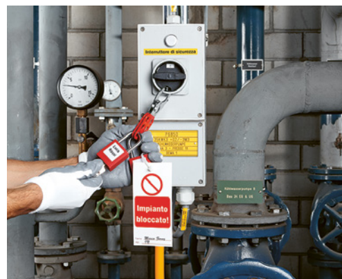
4 Interruttore di sicurezza in posizione 0, bloccato con un lucchetto contro il riavvio

È possibile che nella vostra azienda esistano altre fonti di pericolo su questo argomento. In tal caso, occorre adottare i necessari provvedimenti e annotarli sull'ultima pagina.