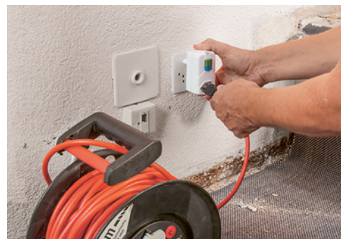
6 In mancanza di un interruttore FI, collegare un interruttore FI (salvavita) mobile.

Prima di iniziare i lavori, i collaboratori si informano presso il cliente sull'ubicazione delle seguenti strutture di emergenza: