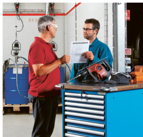
3 Per prima cosa è necessario chiedere al cliente quali sono i pericoli specifici e le relative misure di sicurezza.