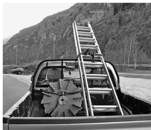
2 Fissaggio del carico sul veicolo