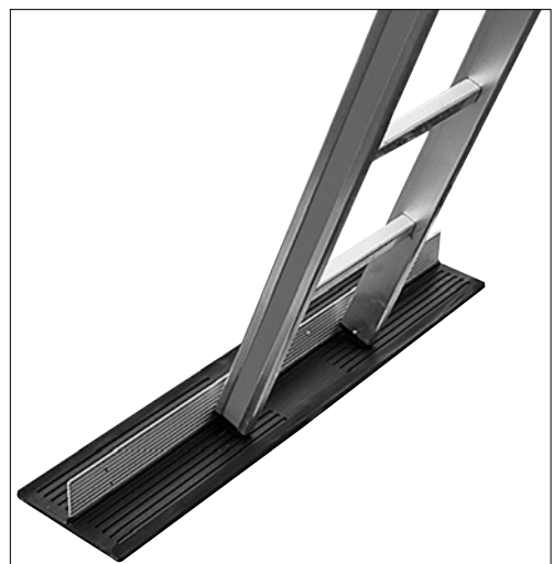
2 Durch eine geeignete Unterlage (z. B. Antirutschmatte etc.) wird das Wegrutschen des Leiterfusses verhindert.