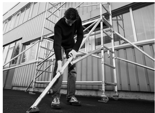
3 Sicherung des Rollgerüsts gegen Kippen.