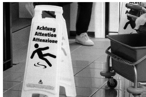
5 Warnständer «Achtung Ausrutschgefahr»: www.suva.ch/99103.d/f/i

Siehe auch Broschüre «Gefährliche Stoffe, was man darüber wissen muss» ( www.suva.ch/1030.d ), Checkliste «Hautschutz» ( www.suva.ch/67035.d ), Film «Napo in: Vorsicht Chemikalien!» ( www.suva.ch – Suchwort: «Chemikalien»).