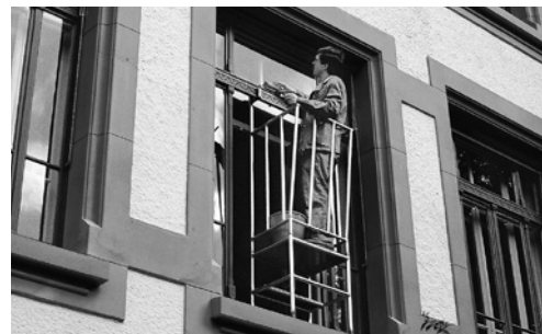
6 Schutzgeländer: lässt sich mit einem Griff zwischen Fenster und Fensterrahmen einhängen.

Siehe auch Checklisten «Elektrohandwerkzeuge» ( www.suva.ch/67092.d ), «Elektrizität auf Baustellen» ( www.suva.ch/67081.d ), «Böden» ( www.suva.ch/67012.d )