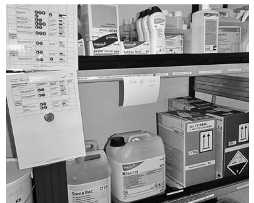
Bild 6: Flüssigkeiten in Lagern mit Auffangwannen aufbewahren. Waschmittel und Chemikalien immer in Originalgebinden, nie in Lebensmittelgebinden aufbewahren.