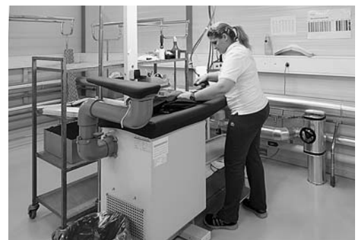
Bild 5: Der Körpergrösse angepasste Arbeitshöhe beim Bügeln. Stromzuführung von oben, sichere Ablagefläche für heisse Bügeleisen vorsehen.