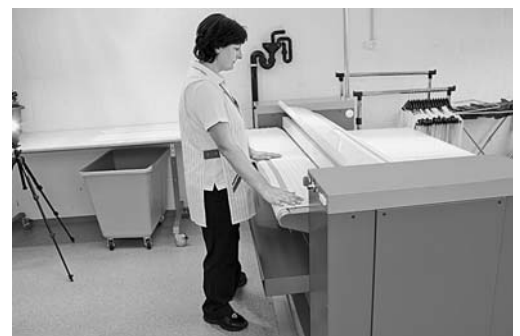
Bild 3: Mange mit Finger- und Handschutz. Bei Berühren der Schutzeinrichtung wird die Maschine sofort abgestellt.