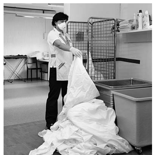
Bild 7: Wäsche mit persönlicher Schutzausrüstung (Schutzhandschuhe und Maske) sortieren.

Es ist möglich, dass in Ihrem Betrieb noch weitere Gefahren zum Thema dieser Checkliste bestehen. Ist dies der Fall, treffen Sie die notwendigen Massnahmen (siehe Rückseite).