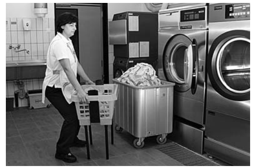
Bild 4: Ergonomische Hilfsmittel und geeignete Arbeitstechniken schonen den Rücken.