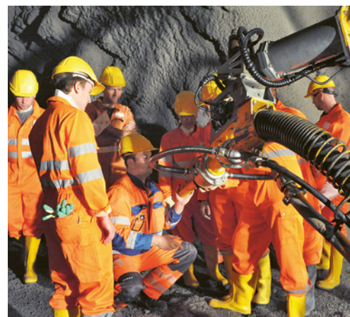
5 Occorre istruire i macchinisti sull'uso della macchina spruzzatrice.