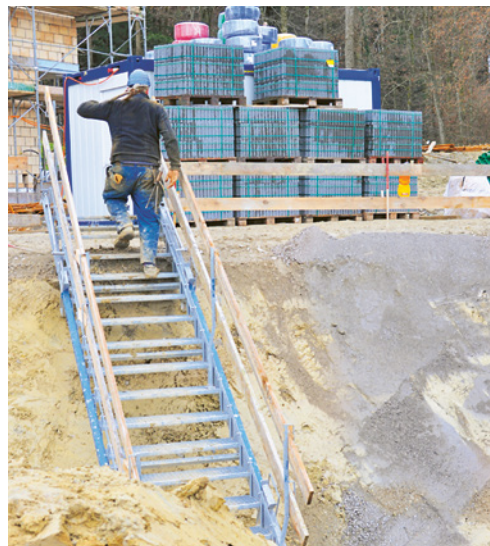
1 Predisporre un accesso sicuro agli scavi.