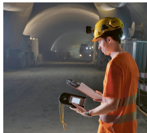
4 Occorre svolgere periodiche misurazioni dell'aria.