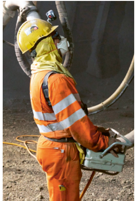
7 I DPI proteggono i lavoratori su più fronti.

È possibile che nella vostra azienda esistano altre fonti di pericolo su questo argomento. In tal caso, occorre adottare i necessari provvedimenti e annotarli sull'ultima pagina.