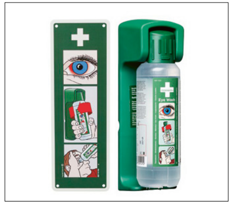
6 Mettere a disposizione una doccia oculare nei pressi del luogo di lavoro.