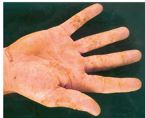
3 Eczema come reazione al cemento