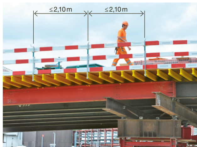
1 Garde-corps périphérique avec lattes de barrage rouges et blanches. Écartement maximal entre les montants: 2,10 m.

Écartement maximal entre les montants pour les garde-corps périphériques avec des lattes de barrage: \leq 2,10\text{m} .