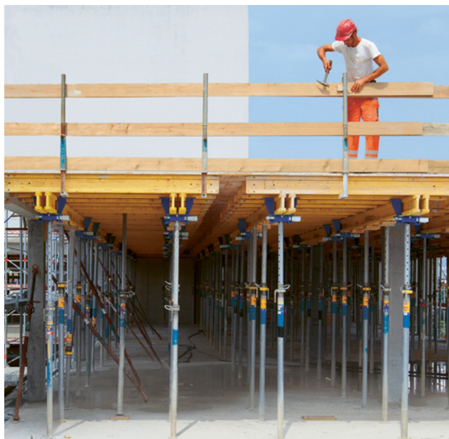
3 Garde-corps périphérique avec montants à pince