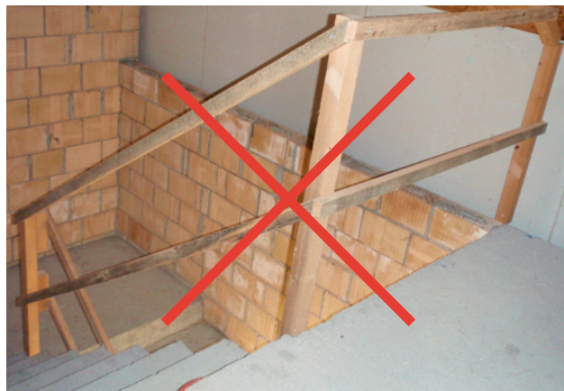
2 L'utilisation de lattes de toit comme main courante dans une cage d'escalier est interdite.