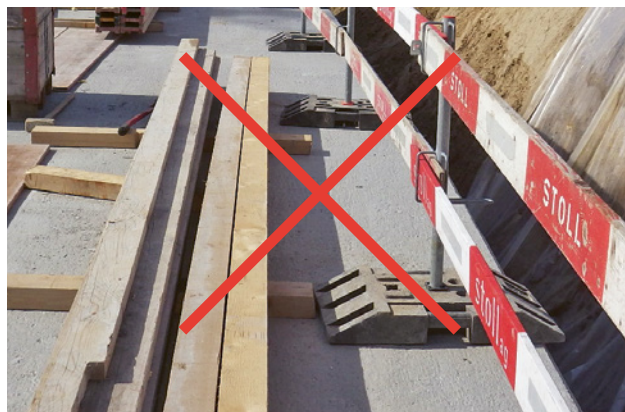
6 Il est interdit de placer un socle en caoutchouc au bord de la dalle car le garde-corps périphérique peut basculer.