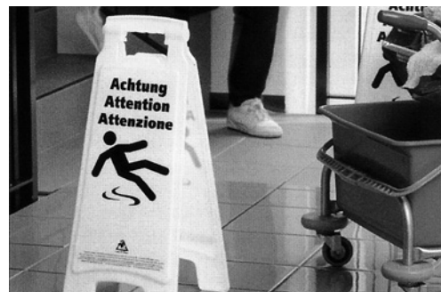
5 Cartello di pericolo «Attenzione: pericolo di scivolare» (codice 99103.d/f/i)