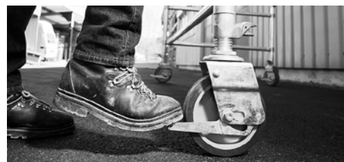
4 Prima di salire bloccare i freni delle ruote.

È possibile che nella vostra azienda esistano altre fonti di pericolo su questo argomento. In tal caso, occorre adottare i necessari provvedimenti e annotarli sull'ultima pagina.