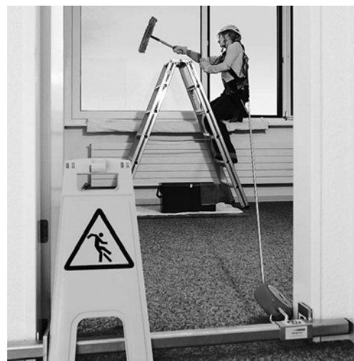
7 La persona è munita di un dispositivo anticaduta di tipo retrattile utilizzabile orizzontalmente. L'apparecchio è fissato a una traversa agganciata al telaio della porta.