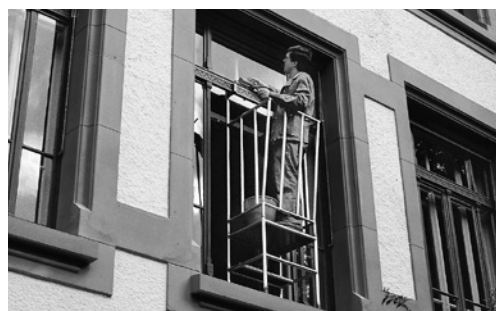
6 Parapetto di protezione agganciato tra la finestra e il telaio