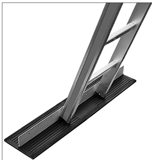
2 Una base adeguata (ad es. tappetino antiscivolo) impedisce che i piedi della scala scivolino via.