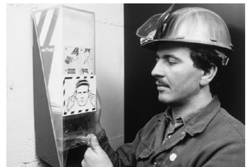
7 Gehörschutzmittel-Dispenser. Die Gehörschutzmittel müssen jederzeit und ohne Umstände erreichbar sein.