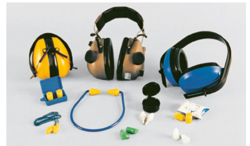
6 Produkteübersicht Gehörschutzmittel.