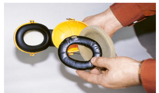
8 Gehörschutzkapseln pflegen und instand halten.

Für die Sensibilisierung und Motivation der Mitarbeitenden eignet sich der Film «Napo – Schluss mit Lärm!»: www.suva.ch/laerm >Material >Filme