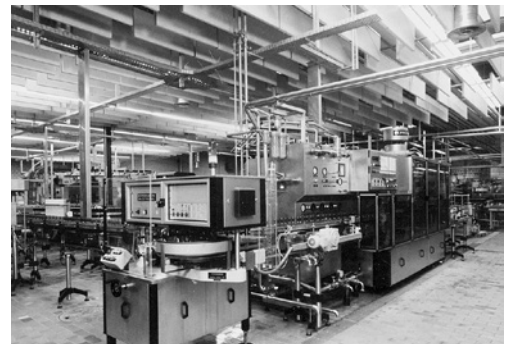
5 Baffeln aus Steinwolle-Akustikplatten in einer Getränkefirma (Abfüllanlage).