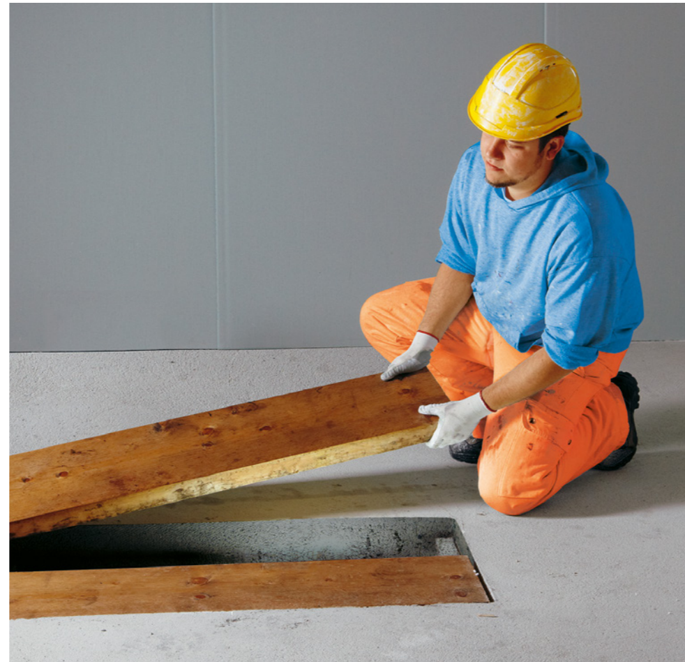
Regel 2: Wir sichern Bodenöffnungen sofort.