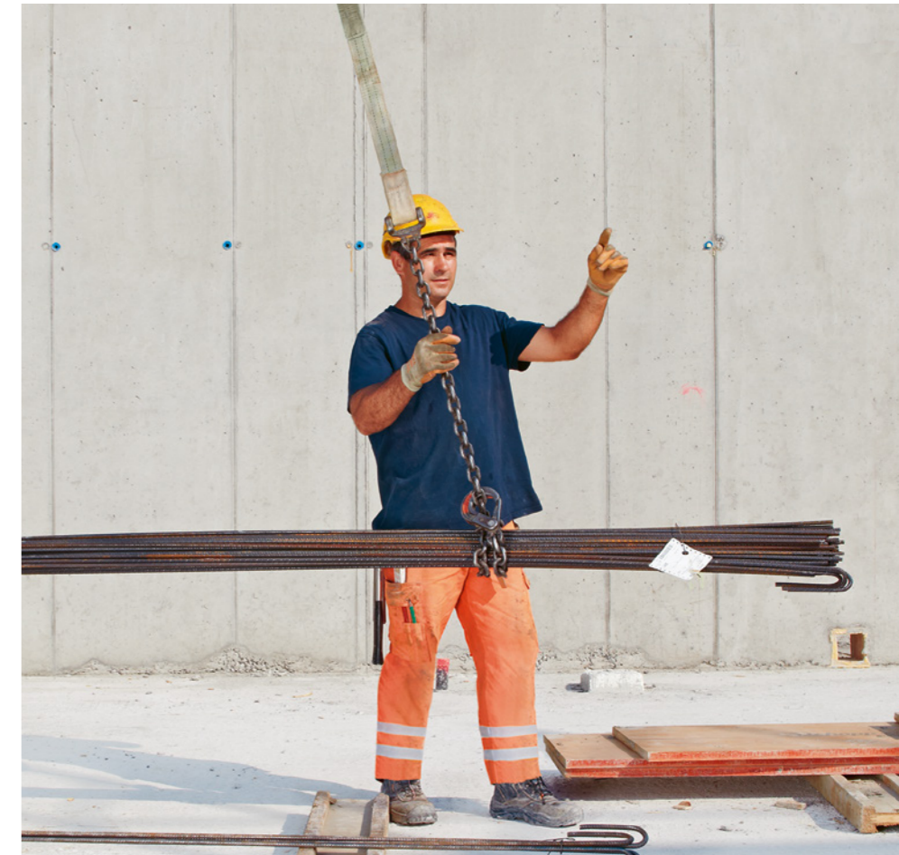
Regel 3: Wir bedienen Krane vorschriftsgemäss und schlagen Lasten sicher an.