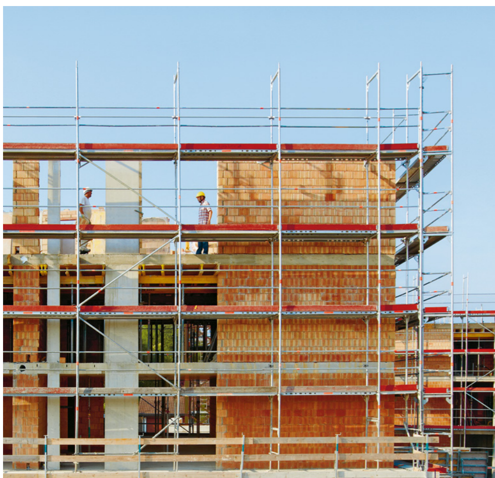
Regel 4: Wir arbeiten ab einer Absturzhöhe von 3 m nur mit Fassadengerüst.