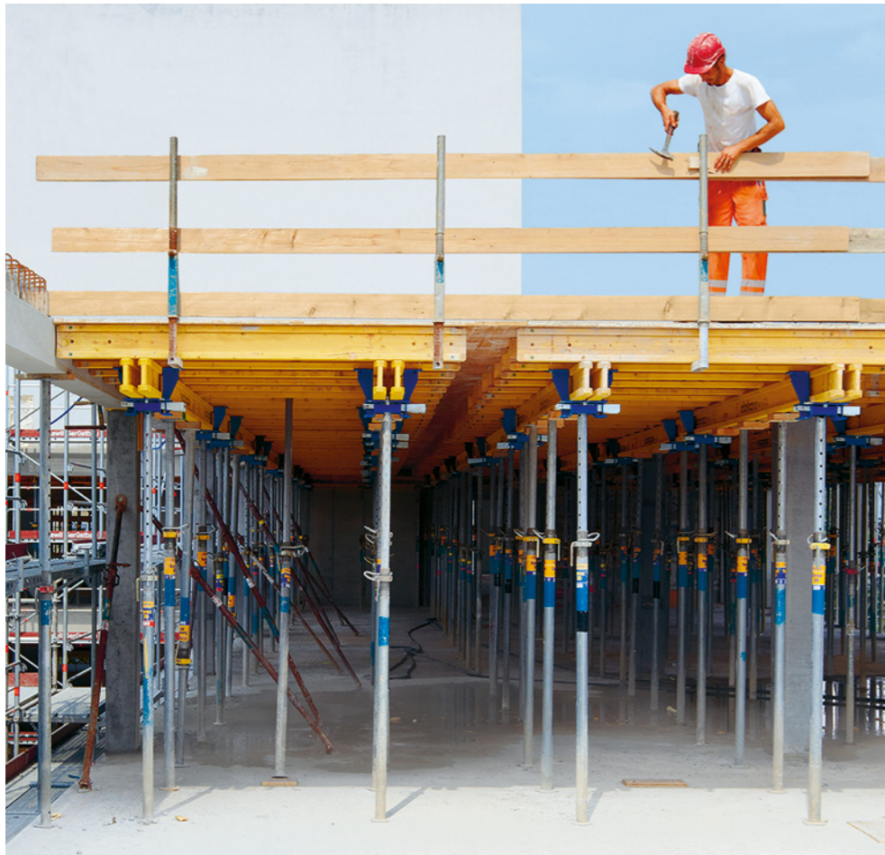
Regel 1: Wir sichern Absturzkanten ab einer Absturzhöhe von 2 m.