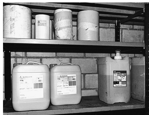
6 Molte sostanze sono sensibili alle variazioni di temperatura.