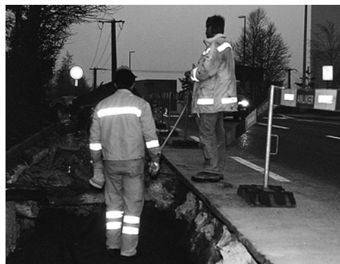
2 L'importante è vedere ed essere visti.