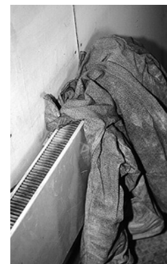
5 Pericolo d'incendio in caso di surriscaldamento. Non appoggiare oggetti infiammabili sui radiatori. Se il riscaldamento è a gas, badare a una buona alimentazione di ossigeno.