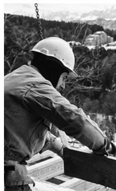
4 Anche indossando un passamontagna è possibile portare il casco.