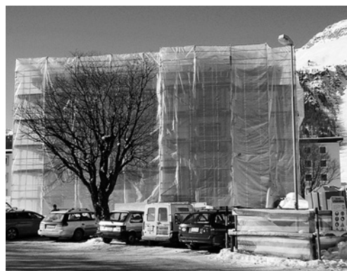
1 Corretta tecnica di sgombero della neve e del ghiaccio.