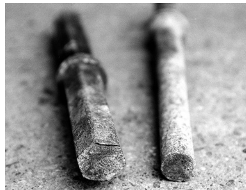
7 A temperature estremamente basse questi ferri sono diventati talmente fragili da spezzarsi come se fossero di vetro.

È possibile che nella vostra azienda esistano altre fonti di pericolo su questo argomento. In tal caso, occorre adottare i necessari provvedimenti e annotarli sull'ultima pagina.