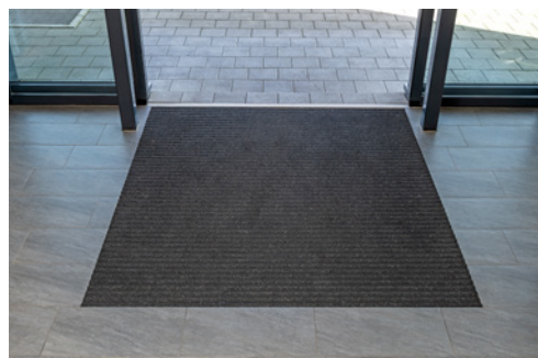
1 Barriera antisporco percorribile in sicurezza

Tali canalette non devono attraversare le vie di circolazione adibite al trasporto di carichi con carrelli elevatori, transpallet e carrelli a mano ecc.