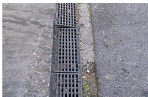
4 Irregolarità nel rivestimento del pavimento possono provocare cadute in piano.