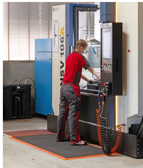
6 Tappetino antiaffaticamento e antiscivolo con spigoli smussati e segnalati chiaramente