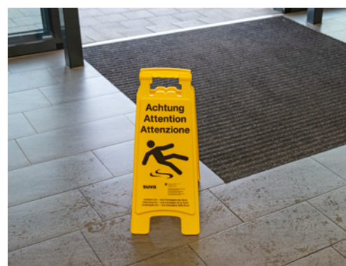
7 Zona scivolosa ben indicata con un segnale di pericolo

È possibile che nella vostra azienda esistano altre fonti di pericolo su questo argomento.