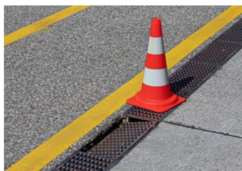
3 Canaletta difettosa indicata correttamente con un cono segnaletico