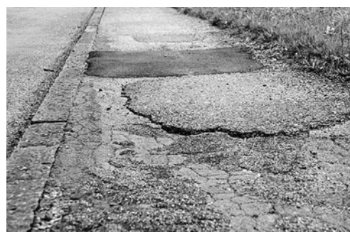
3 Rivestimento riparato malamente; i dislivelli devono essere ridotti al minimo.