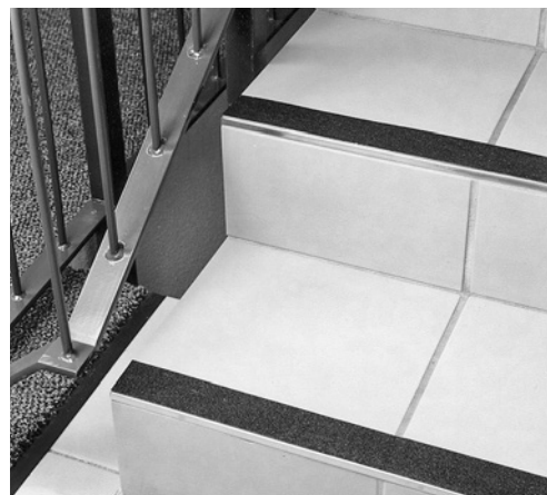
2 Strisce antiscivolo applicate su scalini lisci.