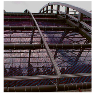
6 Une des premières utilisations au monde lors de la construction de la halle Masoala à Zurich.