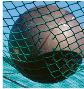
5 Essais de chute avec une sphère de 100 kg lors du test système (hauteur de chute: 2,5 m).