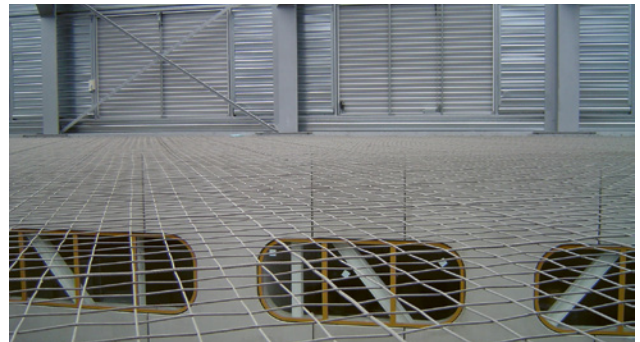
7 Variante en acier inoxydable pour une utilisation de longue durée → Il ne s'agit pas d'un filet de sécurité!