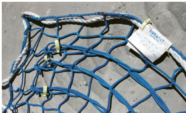
1 Fils de contrôle utilisés pour les essais annuels requis.

Les filets doivent toujours être montés en respectant les instructions du fabricant du système.