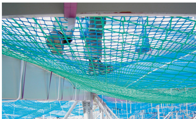
2 Flèche du filet plateforme < 50 cm.