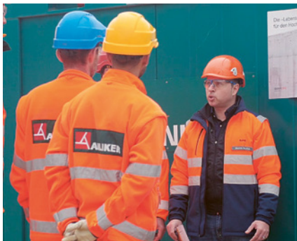
Beispiel Hochbau: Modul «Kaderschulung lebenswichtige Regeln»

Am besten lassen Sie es gar nicht so weit kommen: mit einem aktiven und erlebnisorientierten Engagement im Betrieb lässt sich Leid verhindern. Und es lohnt sich auch finanziell!