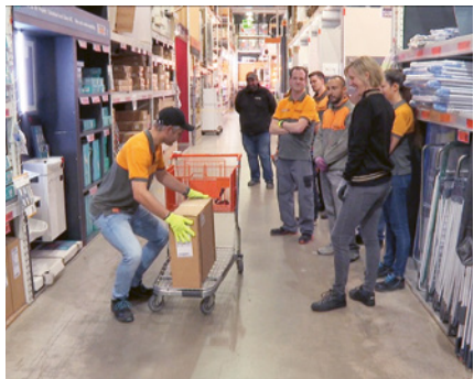
Beispiel Ergonomie: Modul «Richtig heben und tragen»