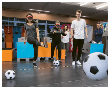
Beispiel Lehrzeit: Modul «Erlebnis-Parcours»

Zu Ihrer Auswahl steht ein umfassendes Angebot aus über 40 Modulen zu 16 verschiedenen Themen: Lebenswichtige Regeln, Schneesport, Lernende, Asbest, Absenzenmanagement, Velo, Stolpern und vieles mehr.