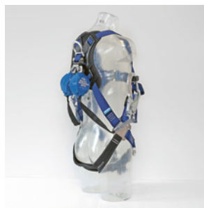
2 Set di DPI anticaduta per l'installazione dei ponteggi di facciata: imbracatura, due dispositivi retrattili da 2,5 m con doppio girevole e moschettone specifico per impalcature (EN 362 + ANSI Z359.12).