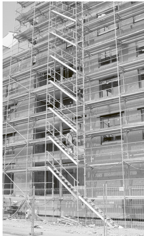
1 Scala che consente un accesso sicuro a tutti i posti di lavoro.