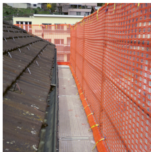
5 Sui tetti con un'inclinazione minima di 30° la parete di protezione da copritetto deve essere conforme alla norma SN EN 13374 per proteggere in modo ottimale dalle cadute dall'alto.

È possibile che nella vostra azienda ci siano altre fonti di pericolo su questo argomento. In tal caso, occorre adottare i necessari provvedimenti e annotarli sull'ultima pagina.