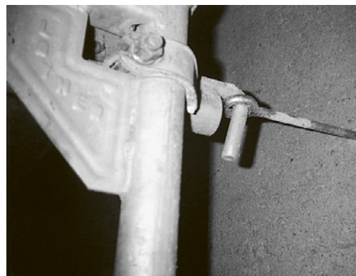
2 Ancoraggio resistente a trazione e compressione costituito da tassello e vite ad anello di portata sufficiente.