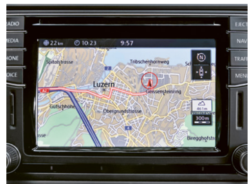
2 Mit einem Navigationsgerät kann man den Standort des Kunden ohne Suchen direkt erreichen.

Dies sind bspw. Winterreifen, Eiskratzer, Schneeketten, Handschuhe, Wolldecke.