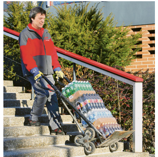
3 Hilfsmittel einsetzen! Z. B. einen praktischen Treppenkarren ...

Es ist möglich, dass in Ihrem Betrieb noch weitere Gefahren zum Thema dieser Checkliste bestehen. Ist dies der Fall, treffen Sie die notwendigen zusätzlichen Massnahmen. Notieren Sie diese auf der letzten Seite.