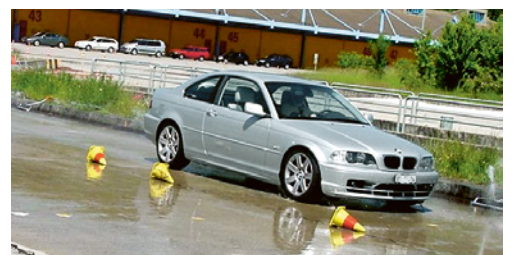
5 In Fahrsicherheitskursen lernen Ihre Mitarbeitenden in praktischen Übungen, sich im Strassenverkehr sicher zu bewegen.