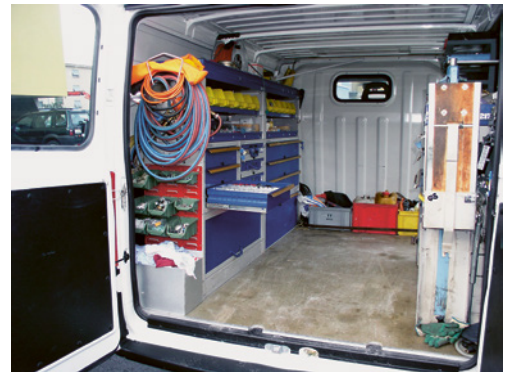
4 Ladungssicherung im Fahrzeug.