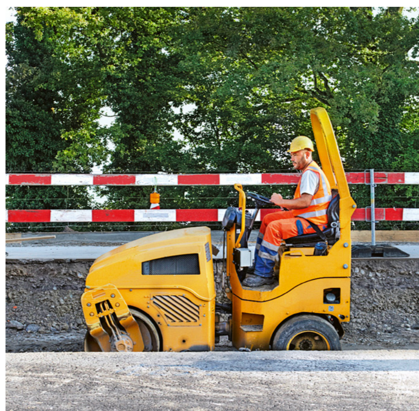
Regola 5: manovriamo le macchine secondo le disposizioni.