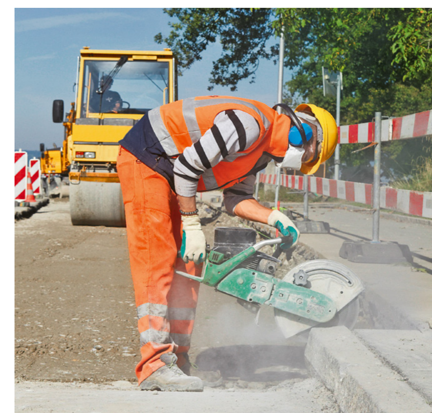
Regola 9: utilizziamo i dispositivi di protezione individuale.