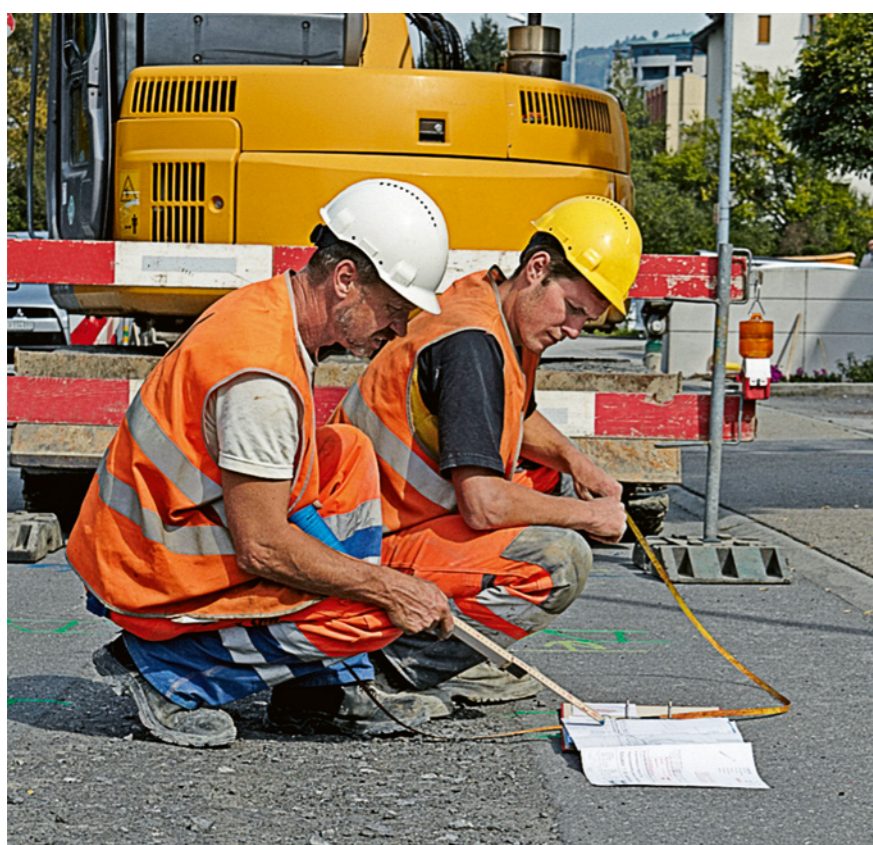
Regola 1: pianifichiamo con cura ogni intervento.