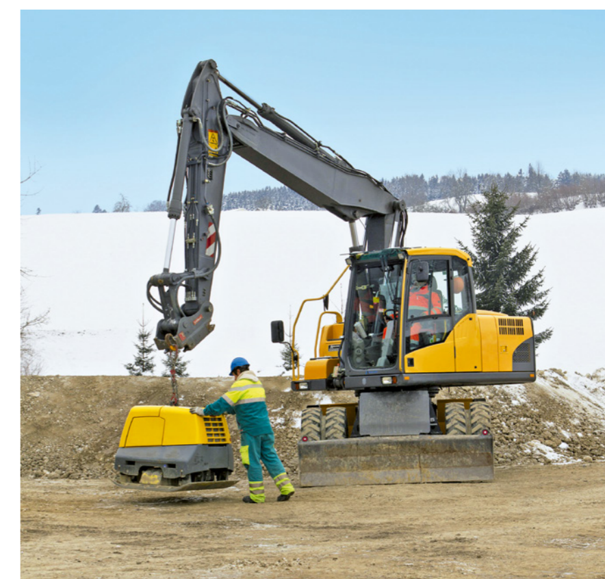
Regola 6: trasportiamo e movimentiamo i carichi in sicurezza.