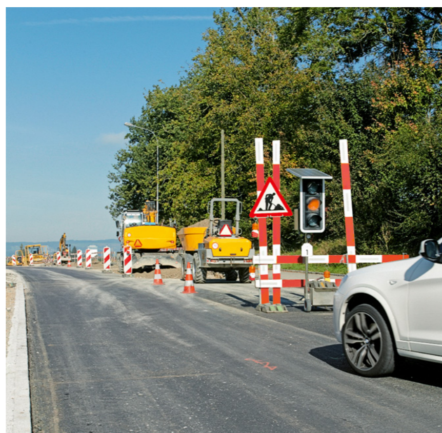
Regola 2: ci proteggiamo dai pericoli legati al traffico.