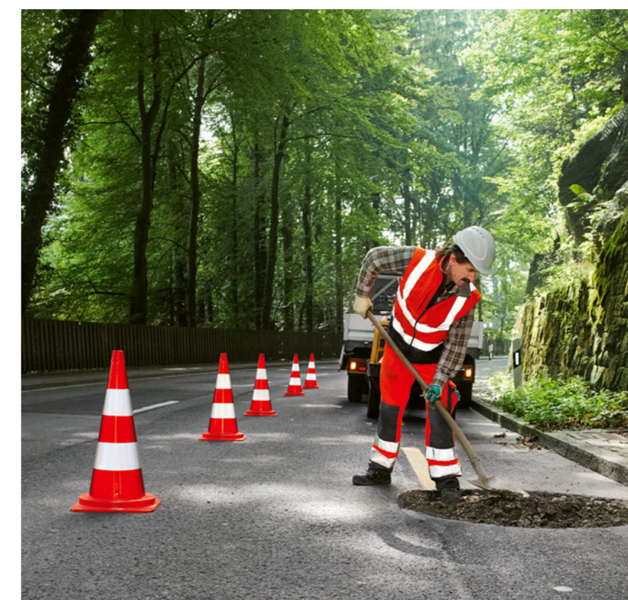
Regola 3: vedere ed essere visti.