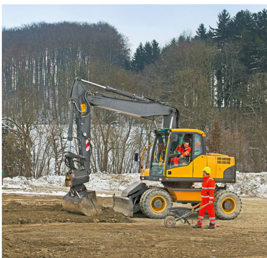
Regola 4: stabiliamo un contatto visivo con il macchinista.