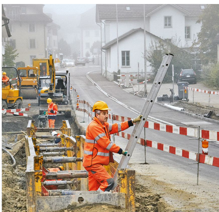
Regola 7: realizziamo accessi sicuri per ogni postazione di lavoro.